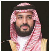
○ سمو ولي العهد السعودي

عاد حضرة صاحب الجلالة الملك حمد بن عيسى آل خليفة، عاهل البلاد المفدى، إلى أرض الوطن أمس قادماً من المملكة المغربية الشقيقة بعد زيارة خاصة. ولقفت جلالة الملك المفدى السلامة في الحل والترحال.