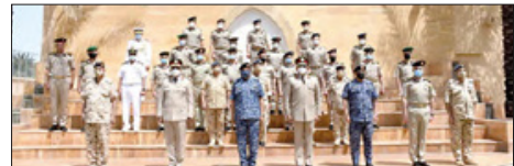
قام وفد من كلية ناصر العسكرية العليا ومن كلية القيادة والأركان للقوات المسلحة بجمهورية مصر العربية الشقيقة، أمس الأحد، بزيارة إلى الكلية الملكية للقيادة والأركان والدفاع الوطني.