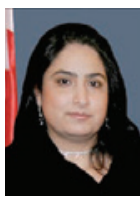
○ الشيخة حصة بنت خليفة بنت عيسى بن عبيد الله آل خليفة

هنأت سمو الشيخة حصة بنت خليفة آل خليفة عضوة المجلس الأعلى للمرأة المكشورة الشيخة بنا بنت عيسى بن عبيد الله آل خليفة، وكيل وزارة الخارجية عضو المجلس الأعلى للمرأة، بمناسبة فوزها بجائزة المرأة العربية للمسؤولية المجتمعية الخمسوية والميدانيسامية الرسمية، من قبل المجلس العربي للمسؤولية المجتمعية، وإنسانت سمو الشيخة