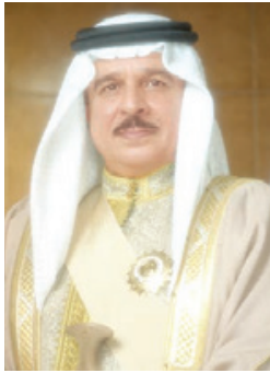
○ جلالة الملك

الصحة والعافية، وأن يحقق لمملكته الغالية وشعبها الكريم المزيد من التطور والازدهار في ظل قيادته الحكيمة.