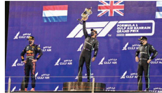
جانب من توجيخ لويس هاملتون بالمركز الأول.

في ضوء التنسيق المستمر مع وزارة التربية والتعليم، أصدرت وزارة الصحة قراراً يقضي بتعليق الدراسة في مدرسة الدراز الإعدادية للبنين، ومدرسة فاطمة بنت أسد الابتدائية للبنات، ومدرسة الروابي الخاصة (المرحلة الابتدائية)، ومدرسة ابن خلدون الوطنية (الروضة والمرحلة الابتدائية)، على أن يتم اتخاذ الإجراءات اللازمة لتواصل الدراسة لجميع الطلبة بعد ختام هذه الفترة. ونص القرار الصادر من الوكيل المساعد للصحة العامة على تأكيد أنه لا يُعاد فتح هذه المدارس إلا بعد أن تتأكد إدارة الصحة العامة من عدم تسجيل حالات قائمة جديدة خلال الفترة المذكورة، والتأكد من استكمال مدة العزل المفروضة للحالات القائمة ومخالطتهم بناء على الإجراءات الاحترازية والبروتوكول المتبع الصادر من قبل الفريق الطبي لتعصدي لفيروس كورونا (توكفيد-19)، إضافة إلى انتهاء المدارس المعنية من تعقيم كل مرافقها قبل استئناف الدراسة وخلوها تماماً من أي نواقل للعدوى، وإصدار إذن بفتحها من الإدارة المختصة.