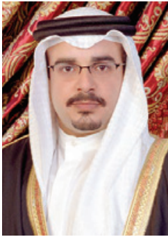
○ سمو ولي العهد رئيس مجلس الوزراء