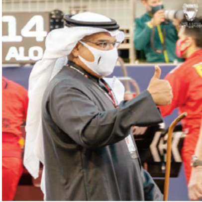
سمو ولي العهد رئيس الوزراء لدى تفقدته زيارة تفقدية للحلبة.

وقال سموه: «لقد كان لتوجهاتكم السامية منذ بدء الجائحة وحتى اليوم بالغ الأثر فيما وصلت إليه البحرين من تميز في إدارة تحدي جائحة فيروس كورونا، ومنها التنظيم المنقّل لهذا السباق وفق الخطة الموضوعية، مضميا سموه أن نجاح تنظيم سباق جائزة البحرين الكبرى يأتي ليضيف لسجل خارطة السباقات العالمية، ويؤكد تميزها في مجال تنظيم سباقات الفورمولا 1 وأحد بسواعد وطنية مخلصا». وتفضل سموه أسس زيارة تفقدية لحلبة البحرين الدولية قبل انطلاق السباق، حيث قام سموه بجولة في منطقة الفرق والمضمار التقى خلالها كبار شخصيات الفورمولا وان، وسيدري الشرق ومتمسجيا، والمختصين، كما اطّلع على التحضيرات النهائية قبل انطلاق السباق النهائي. وأكد سموه اعترافه بعطاء فريق البحرين الذي يسطر اليوم قصة نجاح جديدة بتوفير أسباب التميز والنجاح، في ظل ظرف استثنائي، وما يتطلبه ذلك من استعدادات مضاعفة تكمن أبناء البحرين بعزمهم وإصرارهم من تهيئة الإقامة هذا الحدث الدولي الهام في بيئة رياضية تنافسية ووفق بروتوكولات وإجراءات احترازية تضمن صحة وسلامة الجميع. (التفاصيل على 2 والصفحة الرياضية)