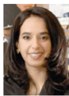
○ الشيخة حصة بنت خليفة بنت عيسى بن عبيد الله آل خليفة