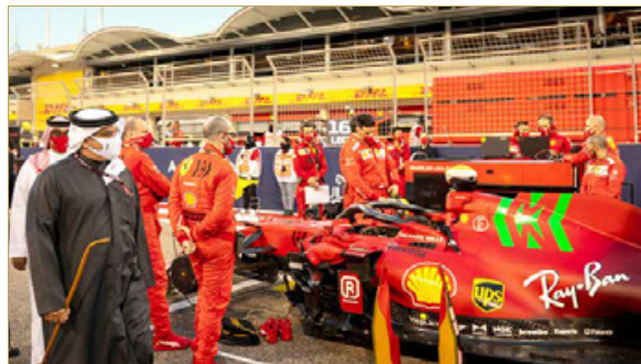
سمو ولي العهد رئيس مجلس الوزراء يزور حلبة البحرين الدولية

سبع مرات للفورمولا 1 البريطاني لويس هاملتون في السباق بعد صراع محتدم مع سائق فريق ريدبول ريسينج الهولندي ماكس فيرستابين، الذي حل في المركز الثاني بعد أن هيمن بأزمته على التجارب الحرة والحصص التأهيلية وانطلاقاً أولاً في السباق.