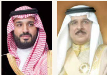
سمو الأمير محمد بن سلمان