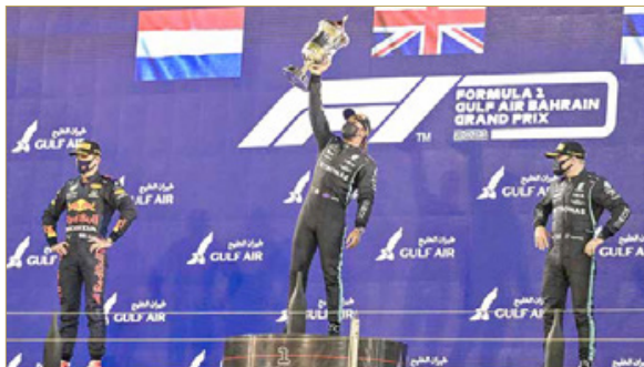
لويس هاملتون يظل جازرة البحرين الكبرى لطيران الخليج

♦ سمو ولي العهد رئيس الوزراء: بالعزم والإصرار حققنا الإنجاز الكبير ♦ هاماتون يخطف بخبرته بطولة "الفورمولا 1"